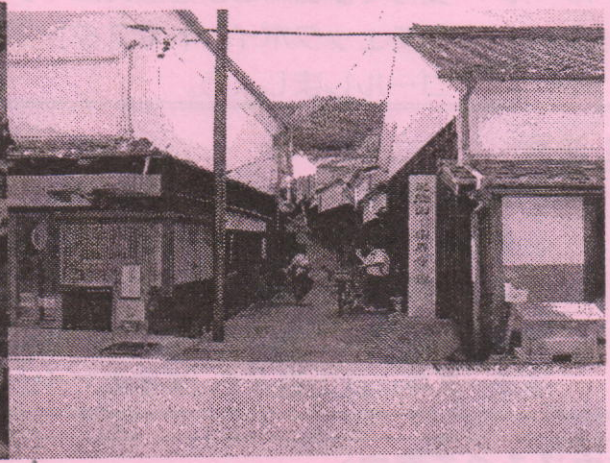
足助の古い町並み